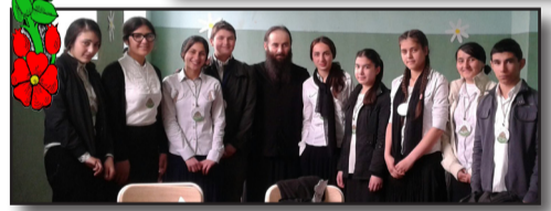
საპატრიარქოს ახალგაზრდული ცენტრის მიერ ორგანიზებული კონკურსის „ჩვენ გსწავლობთ ბი-