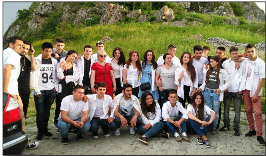
პირველი საჯარო სკოლის XII ა და XII ბ კლასის მოსწავლეები და მასწავლებლები პირველი საჯარო სკოლის დამთავრების ღონისძიებაზე.