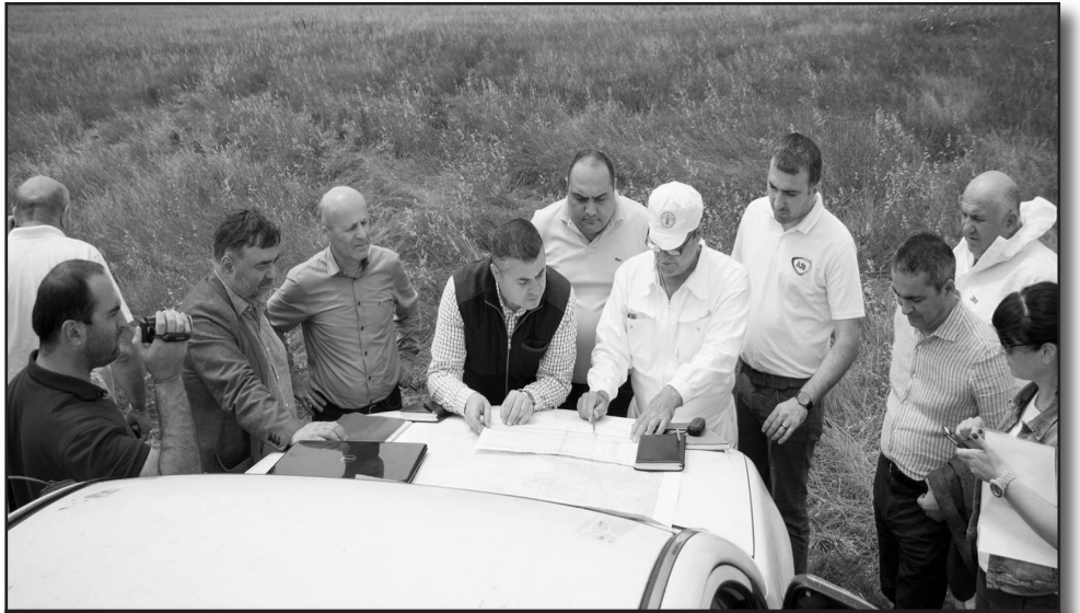
„მსოფლიო ორგანიზაციების ექსპერტების მიერ დათვლილია, რომ ერთ ტონა კალიის მასას შეუძლია იმდენივე პროდუქტის განადგურება, რასაც 2 500 ადამიანი მიირთმევს დღიურად“

„კალია განსაკუთრებით საშიში მავნებელია, რადგან მას საკმაოდ დიდი მწვანე ფართობების განადგურება შეუ-