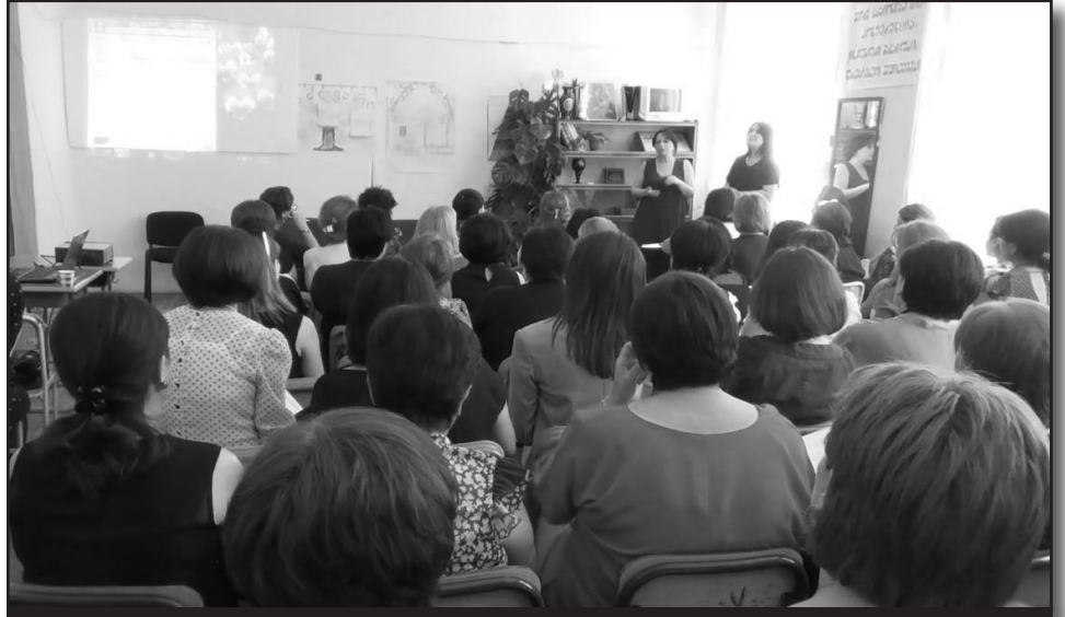
„ბოლო წლების განმავლობაში საკმაოდ შეიცვალა ცნობიერება როგორც მშობლების, საზოგადოების, ისე მოსწავლეების და პედაგოგების...“

მკვლევარების განცხადებით, ინკლუზიური განათლების განვითარების სამმართველოს უფროსი: „შეხვედრის მიზანი იყო, რომ ადგილზე გავცნობოდი ინკლუზიური განათლების მიმართულებით მიმდინარე პროცესებს და ჩვენც მიგვეწოდებინა მათთვის საინტერესო ყველა ინფორმაცია. ვფიქრობ, ძალიან ნაყოფიერი შეხვედრა გამოვიდა, რადგან, განათლების სამინისტროს წარმომადგენლებმა მივიღეთ ყველა ინფორმაცია მათი წარმატებების, თუ არსებული პრობლემების შესახებ. მოვისმინეთ პრეზენტაციები უშუალოდ სპეციალური მასწავლებლების მიერ, კონკრეტული ისტორიების განხილვა გვექონდა. ძალიან მოტივირებული პედაგოგები არიან, იგრძნობა ისიც, რომ თითოეული მათგანი ფიქრობს და მსჯელობს გამოსავალი