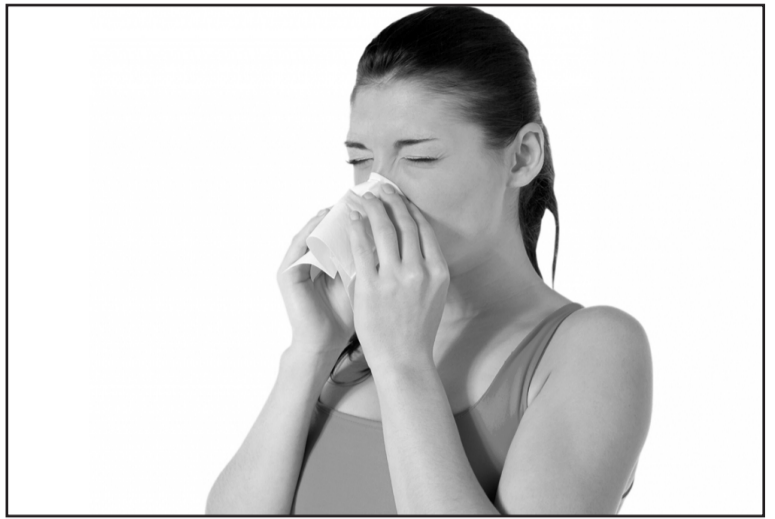
თან, მშრალი კერატოკონიუნქტივის დროს მცირდება თვალის, ცხვირისა და პირის ღრუს ღრუში სიმშრალის ტენიანობა. არსებობს სივრცის სინდრომიც, რომელსაც რევმატიკული ანთროპის მიაკუთვნებენ, მაგრამ ღრუში სიმშრალე და სანერწყვე ჯირკვლების დაზიანება ახასიათებს.

თან, ღრუში კი ერთგვარი ქერქები წარმოიქმნება. ამ სიმპტომებს ზოგჯერ ერთვის თავის ტკივილი, წიაღის არეში სიმძიმის შეგრძნება და ცხვირიდან სისხლდენაც. ცხვირის ღრუს ღრუში გარსის სიმშრალის დროს სუნუნდება რთულდება (ღრუში მოხვედრილი ჰაერი ვეღარ ტენიანდება და იწმინდება). ამ პათოლოგიურ პროცესებს სხვადასხვა რამ იწვევს. ხშირად ღრუში სიმშრალეს პროვოცირებას უწევს კლიმატური პირობები, შენობაში მეტისმეტად მაღალი ტემპერატურა, ჰაერის დაბინძურება, ასევე - ზოგიერთი მედიკამენტი, მაგალითად, ბრონქების გამაფართოებელი და ატროპინის შემცველი პერაპარატები. ცხვირის ღრუში სიმშრალე ზოგიერთი დაავადებისთვისაც არის დამახასიათებელი. მაგალი-