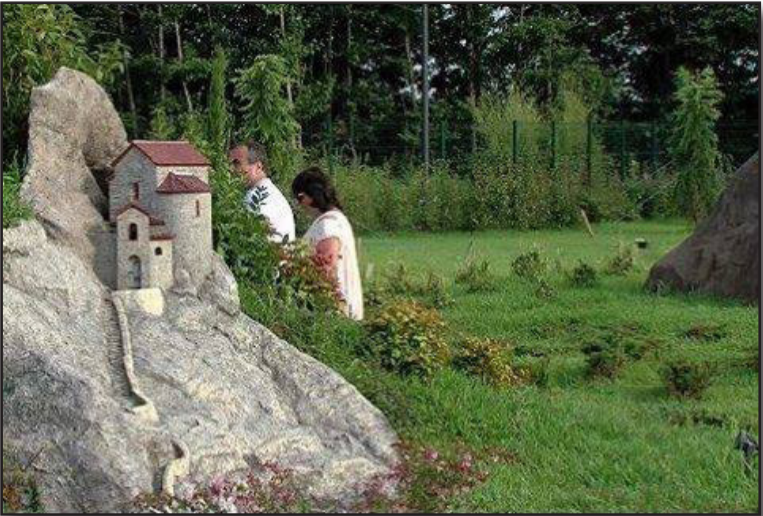
ტურისტული მიმართულება, სადაც მინიატურულ განზომილებაშია წარმოდგენილი საქართველოს კულტურული და ისტორიული ძეგლები და სხვადასხვა ღირსშესანიშნავი არქიტექტურული ნაგებობები. ამგვარი პარკები ბევრ ქვეყანას არ აქვს, ეს არის, მართლაც, დიდი ფუფუნება და, სადაც არის, დიდი პოპულარობით სარგებლობს.“ - განაცხადა გიორგი კვიციანიშვილმა სიტყვით გამოსვლისას.

ჩუქრისთვის და იმედი გამოთქვა, რომ პარკი ხელს შეუწყობს ტურიზმის განვითარებას და საქართველოს კუთხეების პოპულარიზაციას. პრემიერის თქმით, ტურისტულ-რეკრეაციული და საგანმანათლებლო-შემეცნებითი ფუნქციის გარდა, საქართველოში პირველი მინიატურული პარკის დანიშნულებას რეგიონში დამატებითი ინვესტიციების მოზიდვა, ეკონომიკის ნახალისება და მეტი სამუშაო ადგილის შექმნა. „მინდა, საქართველოს მიეწოდოს კიდევ ერთი ღირსშესანიშნავი ობიექტი, რომელიც ბატონი ბიძინა ივანიშვილისა და ფონდ „ქართუს“ საჩუქარია საქართველოსთვის. მინდა დიდი მადლობა გადავუხადო ბატონ ბიძინა ივანიშვილს. ეს არის მართლაც ღირსშესანიშნავი პარკი, რომელიც, დარწმუნებული ვარ, გახდება ერთ-ერთი ყველაზე საყვარელი ადგილი, პირველ რიგში საქართველოს მოქალაქეებისთვის და, რა თქმა უნდა, ტურისტებისთვის. პარკის მშენებლობაზე 10 მილიონ ლარზე მეტი ინვესტიცია დახარჯული. ეს არის ტურისტულ-რეკრეაციული დანიშნულების, ახალი