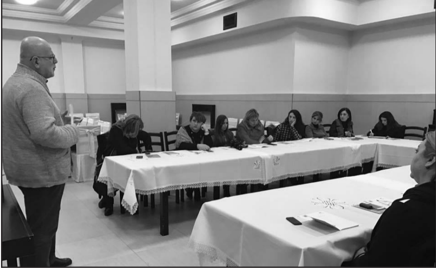
როგორც ვხედავთ, კანონმდებლობაში საკმარისი