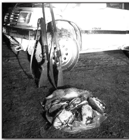
გარემოსდაცვითი ზედამხედველობის დეპარტამენტის, კახეთის რეგიონული სამმართველო

ლოს თანამშრომლებმა, მიმდინარე წლის 10 დეკემბერს უკანონო ნადირობის ფაქტი გამოავლინეს. უწყების მიერ გავრცელებული ინფორმაციის თანახმად, დედოფლისწყაროს მუნიციპალიტეტში სამართალდამრღვევები ნადირობდნენ ე.წ. „პროექტორის“ გამოყენებით. როგორც გარემოს დაცვის ინსპექტორებმა დედოფლისწყაროში ინსპექტირებისას აღნუსხეს, მათ უკანონოდ მოპოვებული ჰყავდათ 1 ერთეული კურდღელი და საქართველოს „წითელი