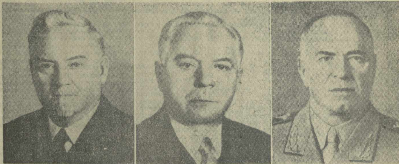
Н. А. Булганин