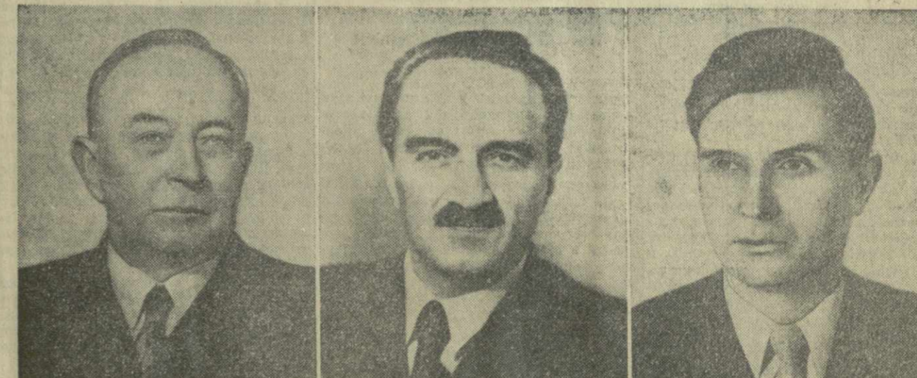
О. В. Куусинен