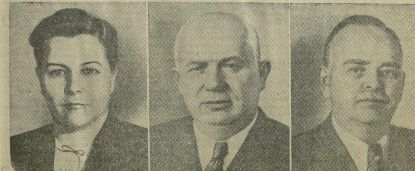
Е. А. Фурцева