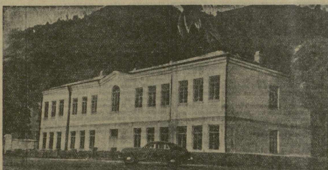
На снимке: новое здание школы в селе Сарни Батумского района.

Много мероприятий намечено для укрепления учебно-материальной базы и улучшения условий работы семилетних и средних школ. Для них будет построено 19 помещений для предметных кабинетов и мастерских. Кроме того, горно-металлургическое производство, Садмельский леспромхоз, комбинат местной промышленности,