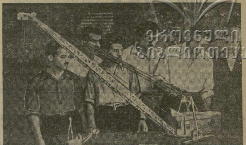
В Тбилисском металлургическом техникуме открылась первая республиканская выставка технического и сельскохозяйственного творчества учащихся техникумов Грузии.

В просторном помещении представлены более 300 работ, выполненных самими учащимися.