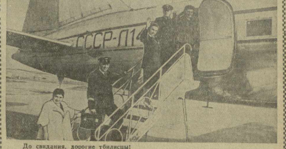
До свидания, дорогие тбилисцы!