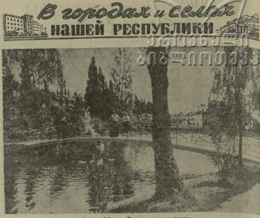
Ахали Афони. В приморском парке.

При катастрофе погибли экипаж и 18 пассажиров, в том числе 1 датчанин, 2 англичанина, 1 американец, 3 немца из ФРГ и 11 советских граждан. Причины катастрофы расследуются. (ТАСС).