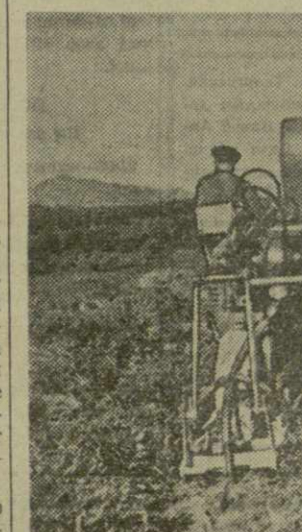
На снимке: глубокорыхлитель «ГР-60» на плантациях Цаленджикского чайного совхоза.

Рыхление на глубину 50 и более сантиметров происходит удовлетворительно. Одновременно с ним проводилось кротование на глубину от 40 до 60 сантиметров. Для этого к нижней части пяти центрального рыхлителя прикреплены приспособление, напоминающее бутылку диаметром 12 сантиметров. Проходя разрыхленную почву, оно образовывало в ней гори-