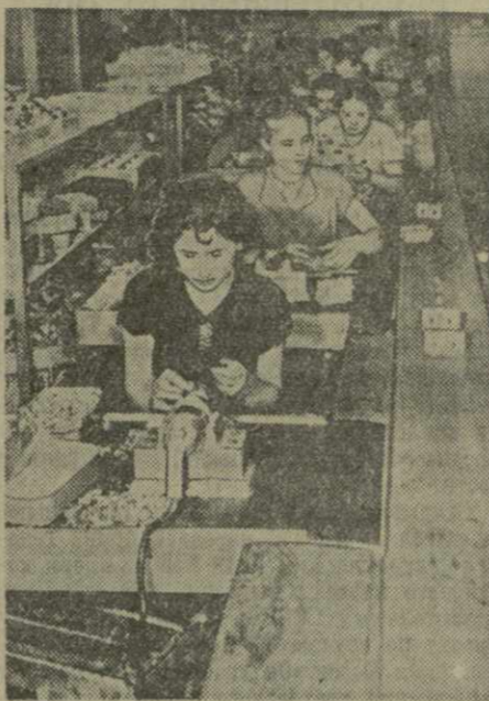
Тбилисский завод «Электротруба» — одно из самых молодых предприятий города. На снимке: конвейер по сборке электротруб.

В республике развертывается массовая закладка силоса. Задача руководителей местных партийных, советских и сельскохозяйственных органов — так организовать работу, чтобы вся силосная масса была своевременно скошена и заложена, чтобы каждый колхоз выполнил взятые обязательства по накоплению кормов для общественного животноводства.