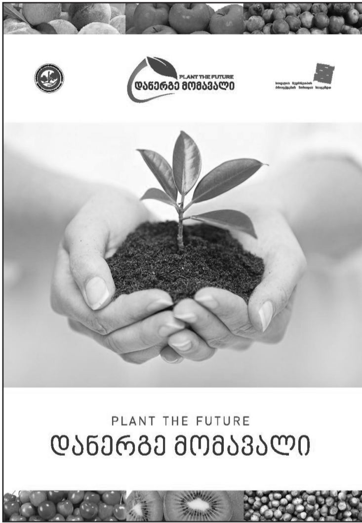
PLANT THE FUTURE დანერგე მომავალი

-საინტერესოა, როგორ განახორციელებენ პროგრამის ორგანიზატორები ჩატარებული სამუშაოების მონიტორინგს, ყველას კარგად ახსოვს, გერმანიის თანამშრომლობის საზოგადოების მიერ განხორციელებული ქარსაფარი ზოლების აღდგენის პროექტი, რომელიც