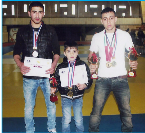
27-28 მარტს ქ. თბილისში ჩატარდა ევრაზიის პირველობა ხელჩართულ ბრძოლაში მონაწი-

ლეობდნენ, როგორც საქართველოს, ისე უცხოეთის სპორტული კლუბები. როგორც ყოველთვის, „ზაქებიც“ მონაწილეობდა ამ დიდ შეჯიბრში.