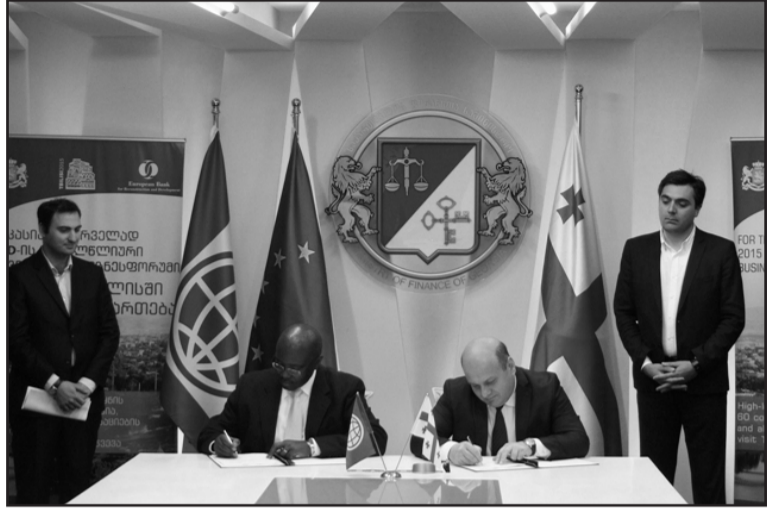
თვითმმართველობებს შორის მჭიდრო და ეფექტიან თანამშრომლობას. აღნიშნული პროექტისთვის, მსოფლიო ბანკის მიერ უკვე

ხელს შეუწყობს ადგილებზე ბიუჯეტების, დაგეგმარების, აქტივების ეფექტიანად მართვის პროცედურების გაუმჯობესებას. მნიშვნელოვანია, რომ პროექტი ასევე ხელს უწყობს ბიზნესის განვითარებას სხვადასხვა მიმართულებით, მათ შორის, ინფრასტრუქტურის, წყალმომარაგების, ენერჯის გამომწვანების კუთხით, რაც სტიმულს მისცემს რეგიონებში კერძო ინვესტიციების მოზიდვას,“ - განაცხადა მსოფლიო ბანკის რეგიონულმა დირექტორმა სამხრეთ კავკასიაში ჰენრი კერალიმ. მუნიციპალური განვითარების ფონდის დირექტორის ილია დარჩიაშვილის განცხადებით, მიღებული ფინანსური დახმარება ასევე ხელს შეუწყობს მუნიციპალური განვითარების ფონდსა და ადგილობრივ