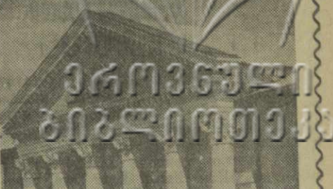
Сейчас проходит республиканский смотр культурно-просветительных учреждений.