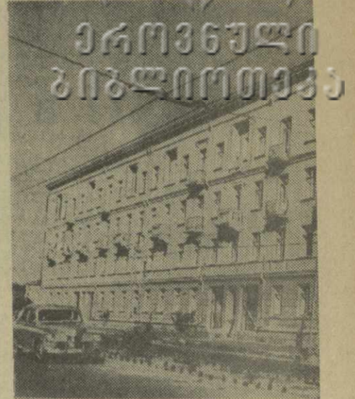
В начале сентября в г. Кутаиси на Горькой улице было передано в эксплуатацию общежитие для рабочих и служащих автозавода. Это четырехэтажный дом состоит из 38 благоустроенных квартир. На снимке: общежитие автозаводцев.