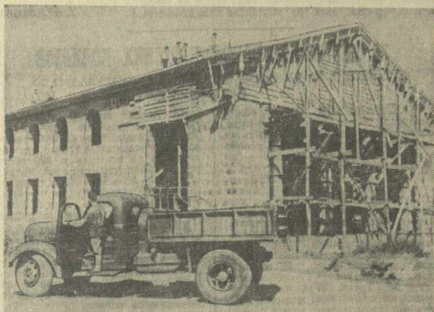
На снимке: строительство Дома культуры в поселке Очхамури.