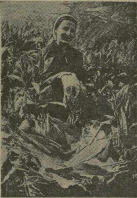
Колхоз имени Кирова села Дандало Келского района располагает табачной плантацией в 16 гектаров. В этом году табаководы колхоза взяли обязательство собрать по 18 центнеров табака с каждого гектара вместо 13, предусмотренных планом.

Колхозники, работники машинно-тракторных станций и совхозов Грузии! Дадим Родине больше продуктов земледелия и животноводства! Порадуем страну новыми славными трудовыми достижениями!