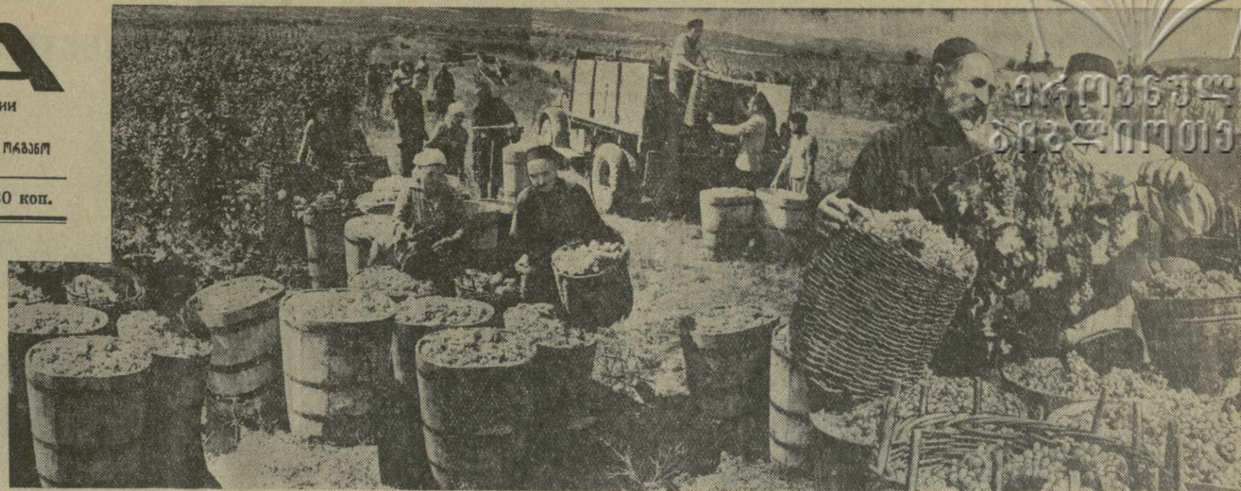
На снимке: сбор винограда в колхозе имени Октябрьской революции села Гурджаани Гурджаанского района.