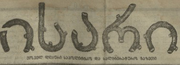
ՄԱՐԿ ԵՐԵՎԱՆԻ ԿԱՆԱԿԱՆՈՒԹՅԱՆ ԱՍ ԿԱՆՈՒՆԱԿՆԵՐԻ ԶՈՐԱՆՈՒ

Երկրի տնտեսական կյանքի մասին տեղի հասցիները տեղի հասցիները հարկի վճարման համար կարևորագույն է: Երկրի տնտեսական կյանքի մասին տեղի հասցիները տեղի հասցիները հարկի վճարման համար կարևորագույն է: