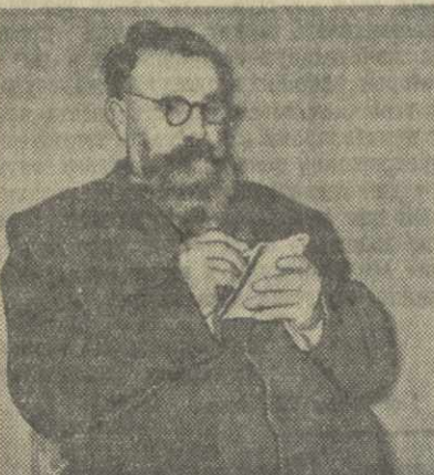
Народный поэт Грузии Галактион Табидзе за работой над новыми стихами, посвященными Октябрю.

Многочисленны подготовлены к изданию сборники очерков «Что я видел за границей» о своем путешествии вокруг Европы. К 40-летию Великого Октября готовлю сборник стихов о Родине, дружбе и мире, в котором отобразю свои впечатления о поездке на VI Всемирный фестиваль молодежи и студентов в Москве. Одновременно работаю над второй частью книги «Над водой кровью», герою которой участвуют в освоении целинных и залежных земель.