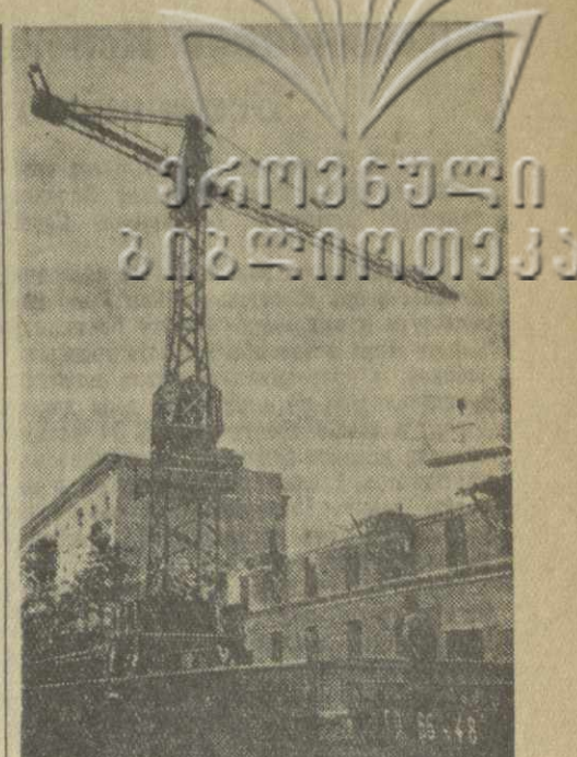
Тбилиси. На улице Паллашвили идет строительство дома для работников треста «Грузшахстрой». Здесь широко используются железобетонные конструкции для сборных, перекрытий. 30-квартирный 5-этажный жилой дом будет сдан в эксплуатацию в конце года.

А когда это было слышно, чтобы болдинский крестьянин учился грамоте, княжик читал? А теперь свою большую школу построил. Вечернюю школу открыл. Для ишнейшей молодежи, видно, и школы на-