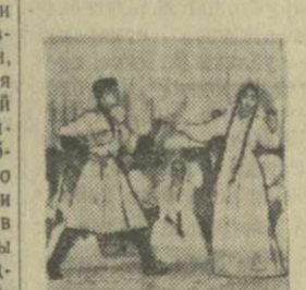
«Свадебный танец» в исполнении самодеятельного коллектива Абхазпромответа.

бань», ряд областных газет Украины. Из этой поездки ансамбль привез с собой 16 граммов и шахтерскую лампочку — за хорошее обслуживание горняков Донбасса.