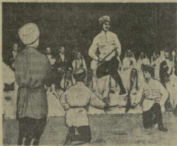
На снимках: артисты Государственного ансамбля песни и танца Абхазской АССР исполняют «конный танец» (слева) и танец «гандаган» (справа).

Нынешняя декада — это праздник культуры Абхазской АССР. Трудящиеся Тбилиси и всей республики горячо поздравляют участников декады и желают им больших творческих успехов.