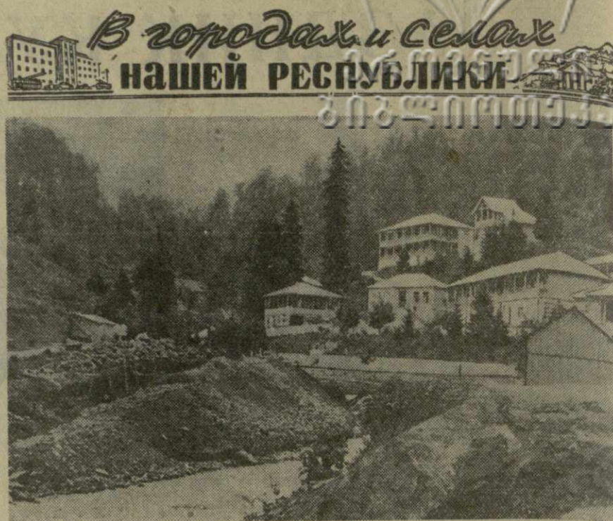
Общий вид курорта Саирме.

Обсуждение финансовых законопроектов в Национальном собрании начнется сегодня днем.