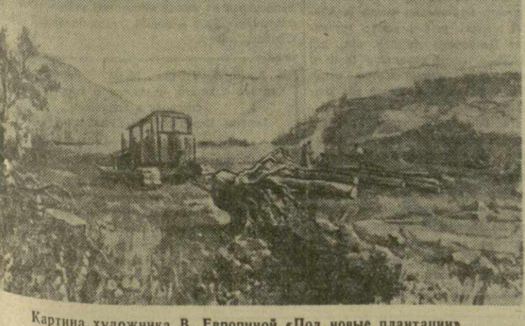
Картина художника В. Европиной «Под новые плантации».