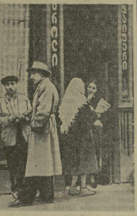
Снимок сделан на проспекте Руставели, около комиссионного магазина. Кулик-продажа идет бойко. Спекулянт чувствует себя вольготным.