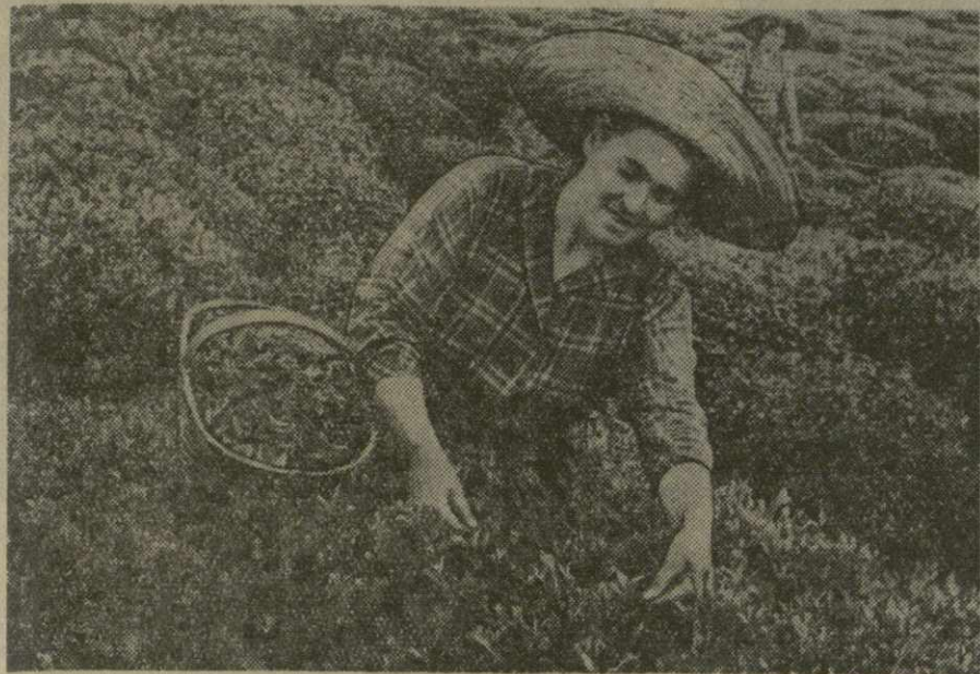
На снимке: мастер высоких урожаев чайного листа звеневая колхоза имени Татяны Чкаидзе села Шрома Махарадзевского района Герой Социалистического Труда