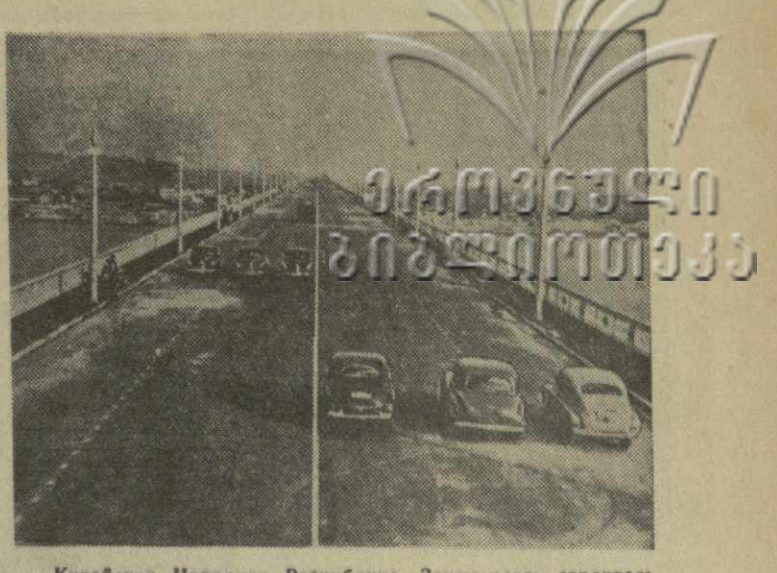
Китайская Народная Республика. Закончилось строительство крупнейшего в Китае моста через реку Янцзы. Новый мост длиной 1.700 метров имеет два яруса: нижний — железнодорожный ярус и верхний — автомобильный. Под мостом могут проходить суда водоизмещением в 10 тысяч тонн. Строительство моста началось в ноябре 1953 года и закончено на 2 года раньше срока. На снимке: новый мост.

НЬЮ-ЙОРК, 15 ноября. (ТАСС). Как сообщает американская печать, кубинские партизаны, возглавляемые популярным руководителем повстанцев Фиделем Кастро, предпринимают решительные действия, направленные на свержение неустойчивого на трясине диктатора Батисты. Партизаны поджигают крупные плантации сахарного тростника и табачные плантации и призывают к объявлению всеобщей забастовки в середине декабря, когда начинается уборка урожая. Пожарами уже уничтожены тысячи тонн сахарного тростника и 50 табачных складов. Рабочие сахарных плантаций в провинции Ориенте не предпринимали никаких попыток потушить пожары. В листовках, распространяемых сторонниками Кастро, выдвигается лозунг: «Либо урожай без Батисты, либо Батиста без урожая. За урожай свободы».