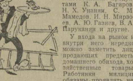
С доставкой на дом, с легким преодолением барьеров.