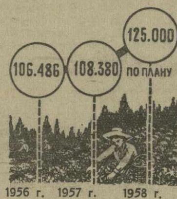
Сбор зеленого чайного листа в Грузии (в тысячах тонн)

Итого первых двух лет шестой пятилетки, как видно из публикуемой диаграммы, говорят о том, что поставленная партией задача об увеличении производства чая выполняется у нас пока еще неудовлетворительно. Последнее время по валовому сбору зеленого чайного листа мы, по существу, топчемся на месте. В нынешнем году собрано и заготовлено всего 1.380