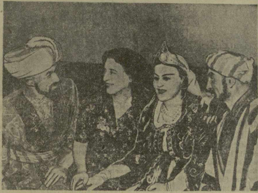
Народная артистка СССР Верико Анджапаридзе беседует с участниками спектакля «Измена»...