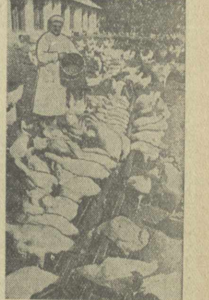
На Гагрской птицефабрике.