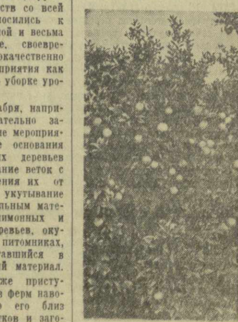
Новый сорт грейпфрута, выведенный на Сухумском опытной станции субтропических культур. Он более морозоустойчив, с ранним сроком созревания плодов.

Д. ЦКИТИШВИЛИ, главный агроном цитрусовых культур Министерства сельского хозяйства Грозинской ССР.