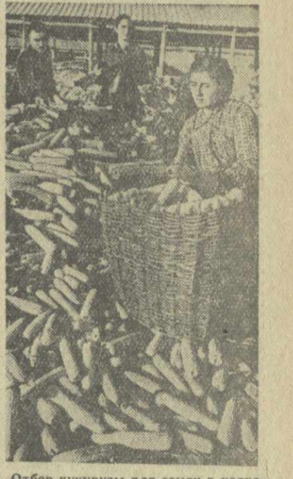
Отбор кукурузы для семян в колхозе села Циклиани Мхитарского района.