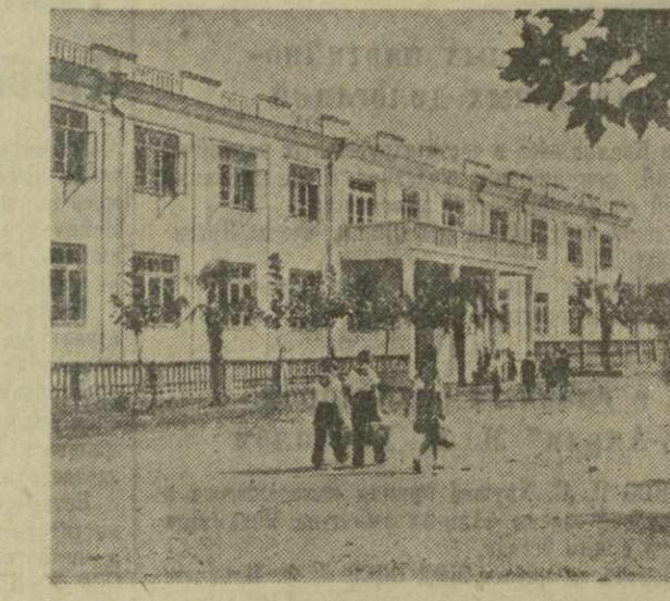
На снимке: новое капитальное школьное здание в колхозе имени Калинина села Макванети Махарадзевского района.

Шемокмеда считается самым благоустроенным селом в Махарадзевском районе. Не хватало Дома культуры, но накануне великого праздника он был открыт. 3 ноября у нас, на родине нашего славного земляка Ф. Е. Махарадзе, состоялось торжественное открытие Дома-музея имени этого выдающегося государственного деятеля. Новые перспективы дальнейшего культурно-бытового строительства открываются трехлетним планом, который мы сегодня обсуждаем. В связи с этим со всей серьезностью встает вопрос об изыскании и использовании местных строительных материалов. Такими резервами располагает наше село. Здесь обнаружены большие залежи дешевого строительного камня. К их разработке должен в кратчайший срок приступить комбинат местной промышленности. Его руководство не должно также медлить со строительством кирпичного завода в Шемокмеде. Во всех этих работах кровно заинтересованы наши сельчане. Они готовы принять самое широкое участие в создании каменных карьеров и кирпичного завода.