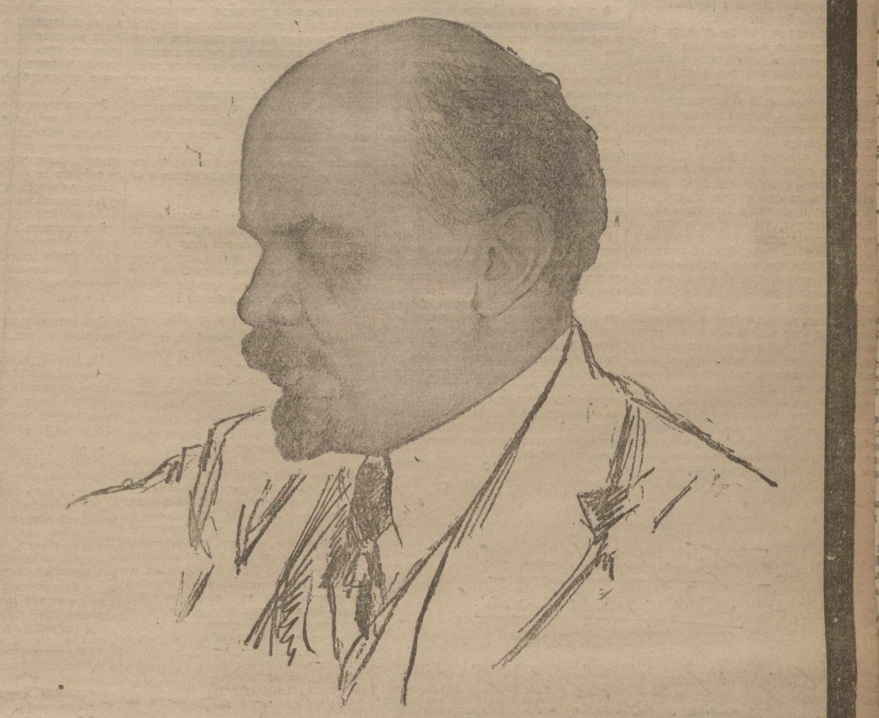
Ленин и Закавказье

Наше единство рабочих и крестьян стало угрожать новой опасностью. В нашей сельскохозяйственной стране, где подавляющее большинство населения составляет крестьянство, где пролетариат представляет не-