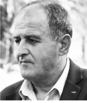
და საზრუნავი გახდა, მის შემდეგად გამოწვეულ ზარალს ვითვლიდით...