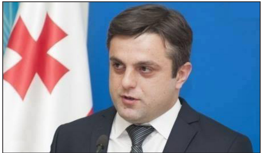
ირაკლი ლარიბაშვილი საქართველოს პრემიერ-მინისტრი

გილოცავთ ელიაობას და დედოფლისწყაროობას ერთად! მიხარია და ამავალი ვარ, რომ „დედოფლისწყაროობის“ დაარსება ჩემი გამგებლობის დროს ჩემი ინიციატივით მოხდა. წმინდა ელია ჩვენი რაიონის მფარველია, მას გამორჩეული ადგილი უკავია დედოფლისწყაროელების ცხოვრებაში, სწორედ მას ავედრებდნენ ჩვენი წინაპრები მოსავალს და წვიმის მოსვლას შესთხოვდნენ. ასეა დღემდე. ელიას მთაზე საუკუნეების წინ აშენებული და დღეს ალღენილი უფლის სახლიც, რომელიც მართლაც უნიკალურია, იმაზე მეტყველებს, რომ დედოფლისწყაროელები ყოველთვის განსაკუთრებულ პატივს მიაგებდნენ წმინდა ელიას და თავიანთ სცემდნენ მას.