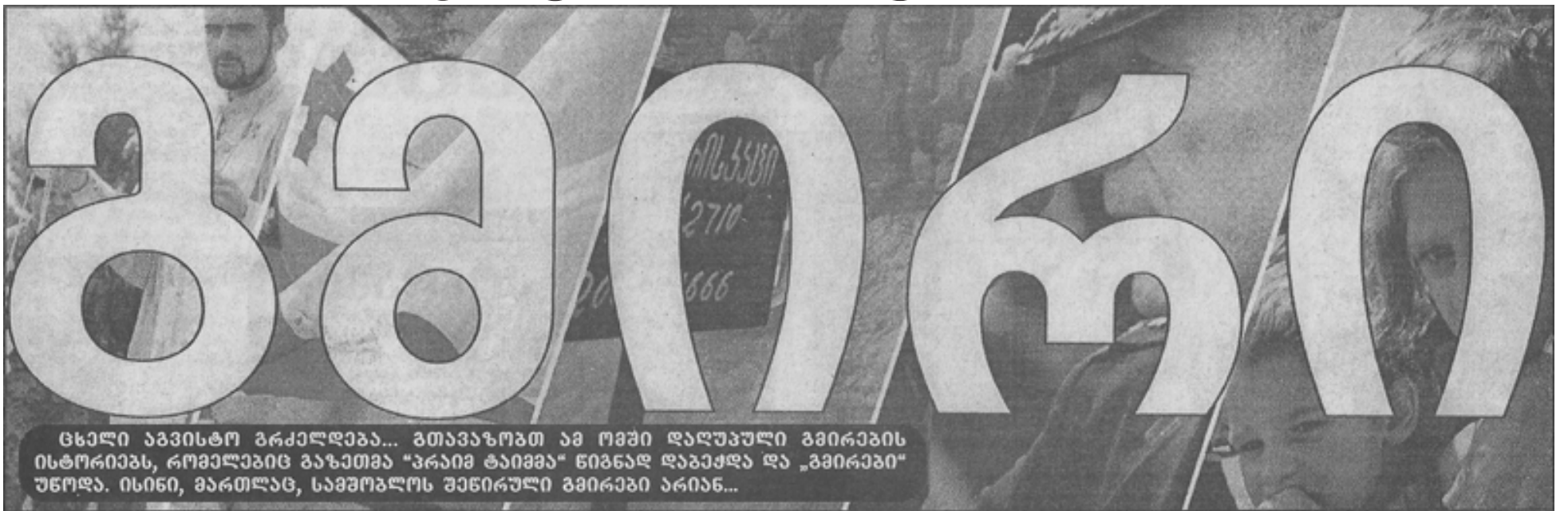
ცხელი აპრილი გრძელდება... გთავაზობთ ამ ომში დაღუპული გმირების ისტორიებს, რომლებიც გაზეთმა "პრაიმ ტაიმმა" წიგნად დააბეჭდა და "გმირები" უწოდა. ისინი, მართლაც, სამოქალაქო მხარეში გმირები არიან...