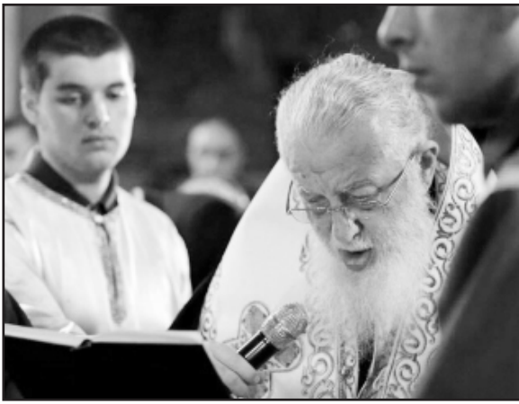
პატრიარქმა შესთხოვა უფალს, მოიღოს მადლი და წყალობა ჩვენზე და უფლის

კურთხევა და მფარველობა ყოფილიყო საქართველოზე.