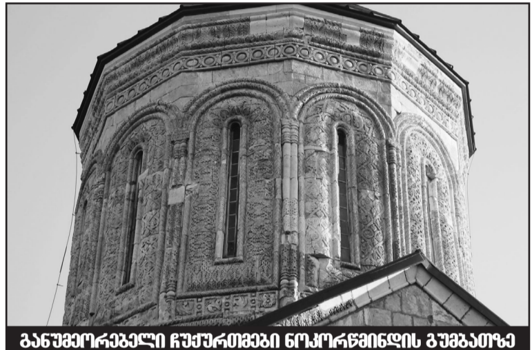
განუყოფადი ჩუქურთვაი ნოკორწინის გუმბათი

ბული ტბის მყრალი ჰაერით დამძიმებულს, მზის მცხუნვარებითა თუ ადამიანის უტიფრობით და დაუდევრობით გადამწვარ-გადამწმარი მინდვრებისა და ქარსაფარების მაყურებელს აქაურობა ედემად მიჩვენება. აქ მავიწყდება გლობალური დათობაც და გაუდაბნოების რეალური საფრთხეც. აქ ვგრძნობ, რომ ხელუხლებელი ბუნება, მართლაც რომ, მბრძანებელია. პატარა კურორტიდან დიდი კურორტისკენ, შოვისკენ მივდივართ. ცამდე აზიდული შერეული ტყით დაფარული მთები მოქარგულს ჰგავს თავისი სიმეტრიული განლაგებებით. მათ გადაღმა კავკასიონის მყინვარები ილანდება. ცქერით ვერ ვძლები და ოცნებაში ვერ მოვიდგენ, რაოდენ ლამაზი იქნება აქაურობა გვიან შემოდგომაზე, როცა წინწარის მუქ-მწვანეში ფოთლოვანი ხეების ნითელყვითლად აელვარებული ფერები შეერევა. გზისპირებზე თავი ნამოუყვიათ სულ ნორჩ, ქორფა ნაძვის და ფიჭვის ბუნებრივი განახლებით აღ-