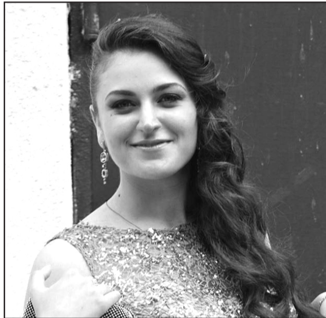
პირველკურსელი, მომავალი ევროპათმცოდნე, არაჩვეულებრივად დადებითი აურის მქონე, ნიჭიერი, ერუდირებული, რა თქმა უნდა მედალოსანი და რატემაუნდა გრანტიანი,