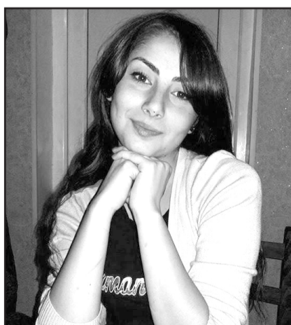
საქართველოს უნივერსიტეტის პირველკურსელი, ნიჭიერი, შრომისმოყვარე, უმშვენიერესი საქალბატონე