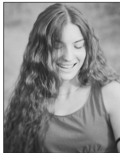
საქართველოს უნივერსიტეტის საზოგადოებასთან ურთიერთობის ფაკულტეტის სტუდენტი

—კავკასიის უნივერსიტეტის ბიზნესის ადმინისტრირების ფაკულტეტის პირველკურსელი. გიგამ 70%—იანი გრანტთან ერთად უნივერსიტეტის შიდა დაფინანსებას მიიღო წელიწადში 2 900 ლარის ოდენობით... გიგას სტუდენტობა ფინანსდება 17 900 ლარით!!!!!!!