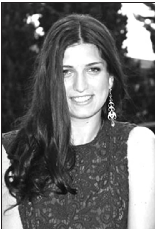
კავკასიის უნივერსიტეტის პირველკურსელი, ნიჭიერი, ერუდირებული, წარმატებული, კეთილშობილი, ჰაეროვანი, უმშვენიერესი, უსაყვარლესი