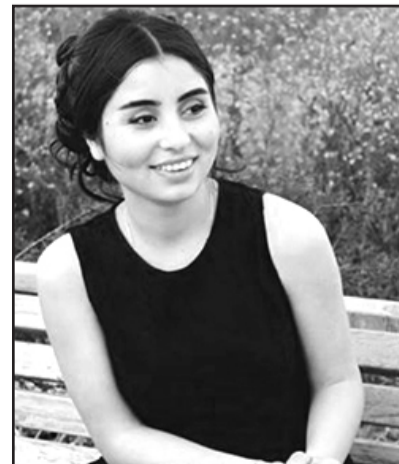
მომავალი სამართალმცოდნე (50%—იანი დაფინანსებით) ივანე ჯავახიშვილის სახელობის თბილისის სახელმწიფო უნივერსიტეტის მედიცინის ფაკულტეტის პირველი კურსის სტუდენტი