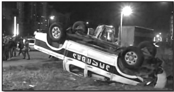
ბისაქენ სწრაფის გამოვლინებად.

სუფლებას „ადგილობრივი კადრი“ შეერჩია, სწორედ ამას აკეთებდა ცენტრალური მთავრობა (წინააღმდეგობა) მთელი ამ წლების განმავლობაში, მაგრამ ის „ადგილობრივი კადრი“ ადგილობრივი საზოგადოების გაღიზიანებას ვერ ბედავდა „აბეზარი ჯარიმებით“, რომლებიც „ადგილობრივებს“ რაღაც შემანუხებელ, „გარედან“ თავსმოხვეულ ლამის „იმპერიალისტურ“ მონაგონად მიაჩნიათ, ხოლო მათ წინააღმდეგ ბრძოლა - „ავტონომიური