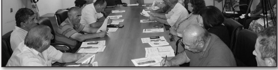
მასალა მოამზადა ილია მარტყოფლიშვილმა

ტრენინგის მიზანს წარმოადგენდა გადამწყვეტილების მიმღებ პირთა, ადგილობრივი ფერმერებისა და სხვა დაინტერესებულ მხარეთათვის ამ მხრივ ცნობიერების ამაღლება, ასევე ნიადაგის, ლანდშაფტების მართვის მეთოდების გაცნობა.