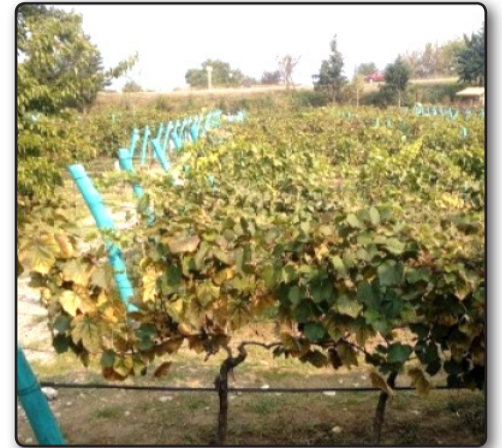
მ მ . 2