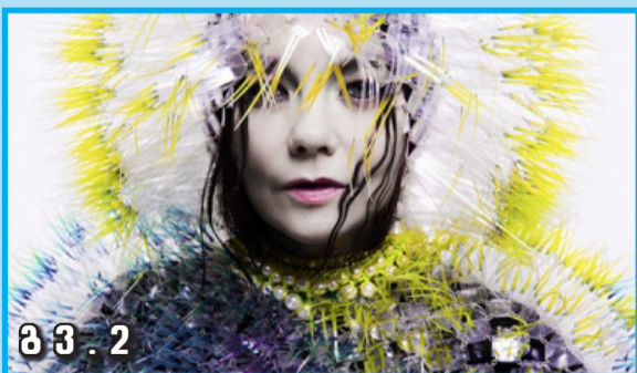
მ მ . 2

გაჭიანურებული ტენდერი და შეწყვეტილი რეაბილიტაცია