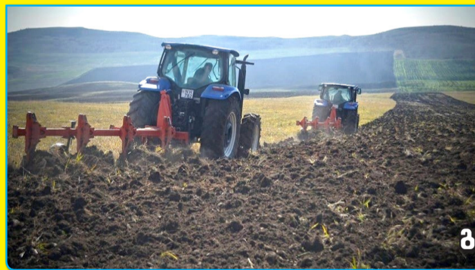
მ მ . 2

კახეთში საშემოდგომო სვნის სამუშაოები აქტიურ ფაზაში შევიდა