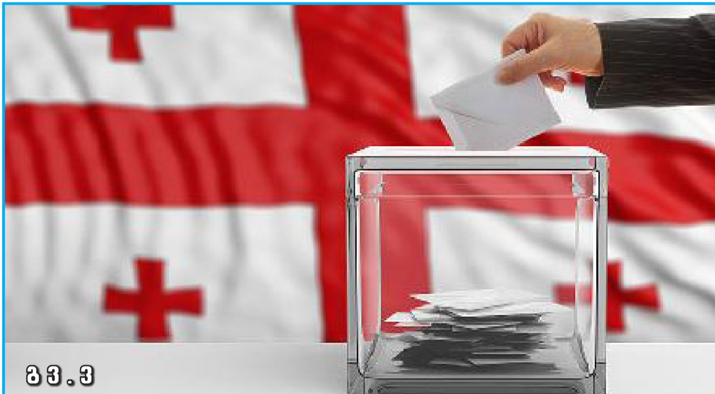
მ მ . მ

ვინ არიან და რა უფლებები აქვთ მერებს და საკრებულოს დეპუტატებს?