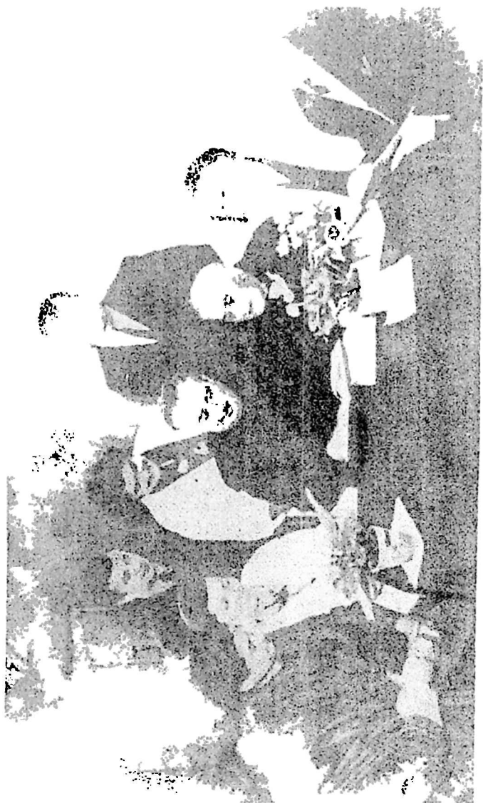
From left to right: the bride, the groom, the bridesmaids, and the groomsmen.