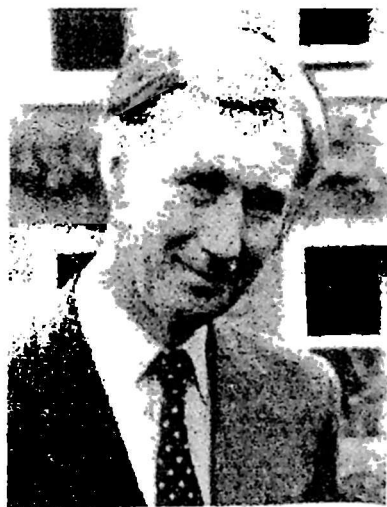
Սեւակյան Խաչատր Վահագնի Վահագնի Վահագն Վլենտինյան