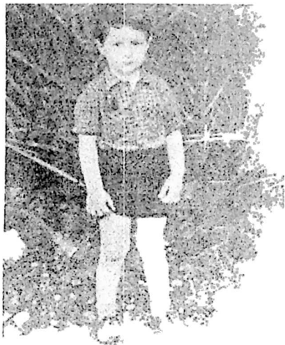
Կոչարյանի մրցակցը Ջրոյ