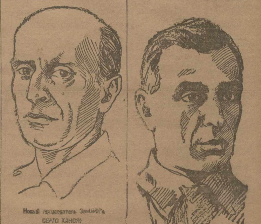
Новый государственный секретарь ЗСФСР СЕРГЕЙ ХАНОН.