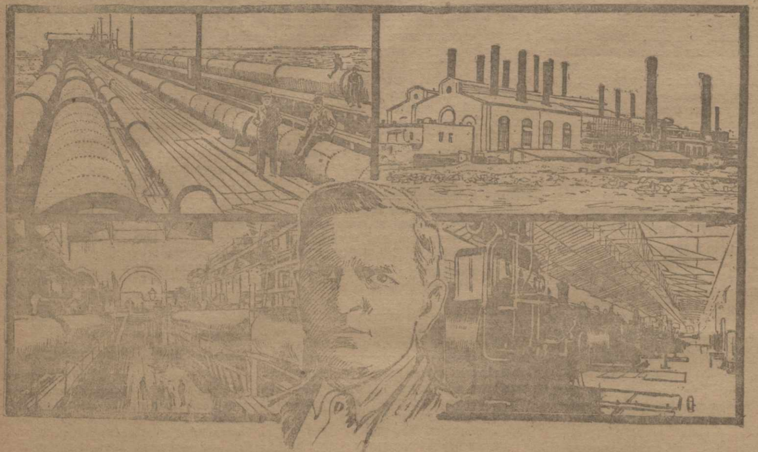
1) Трубопровод, подающий ежедневно 280 мил. ведер. 2) Турбины.

БАКУ, 15 апреля. Центральная электростанция «Красная Звезда» — главный нерв нефтяных промыслов и заводов Баку. По своей мощности электростанция сопоставима с крупной электростанцией СССР, давшей в 1924 г. годов выработку 220.809.000 киловатт-час.