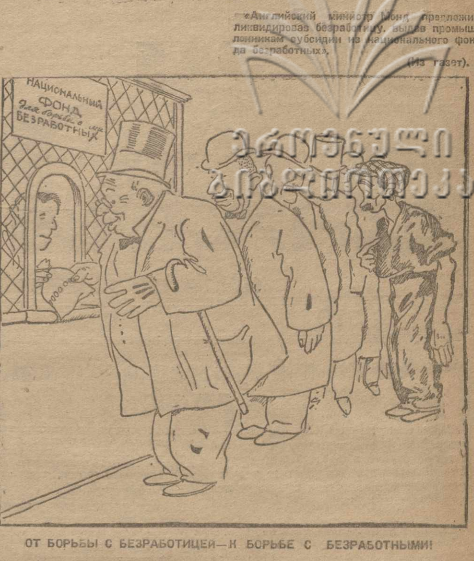
От борьбы с безработицей — к борьбе с безработными!