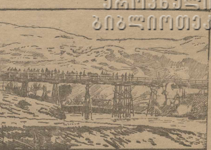
АХАЛ-СЕНАНИ. Мост через р. Цива, законченный в текущем году.

ДЕЛИМАН, 8 мая. Делиманский комитет партии проводит работу по развитию. Развитие является одним из приоритетных направлений народного образования.