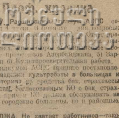
ГАНДИА. Не хватает работников — важно обеспечить нужды государственного управления...