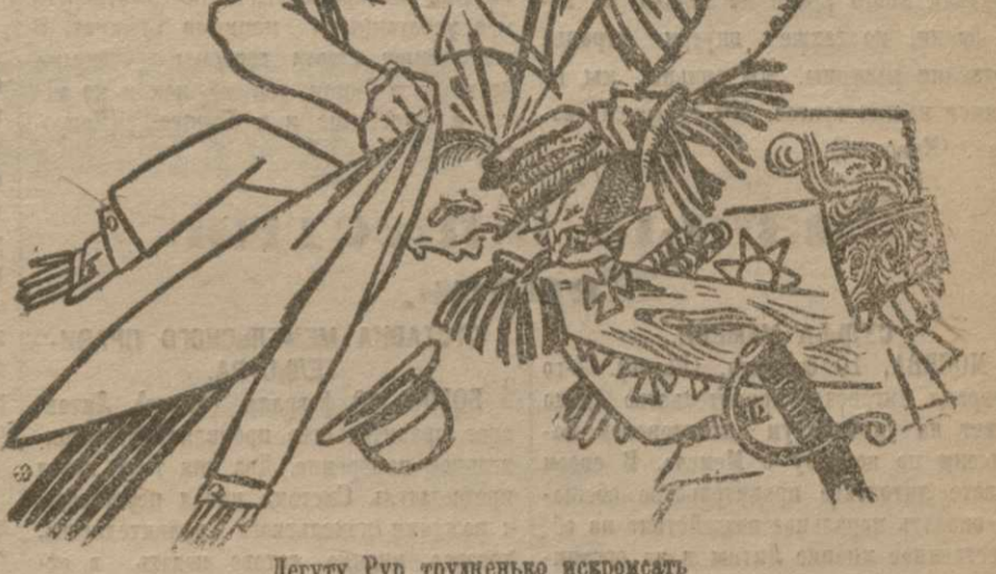
Депутат Гур труднейшею искоренять и Купо — жалкое из жалких мздоимцев.

Ультиматум смирских властей. Турция и союзники.