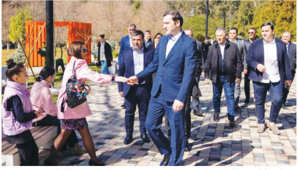
ქობულეთის მუნიციპალიტეტის სოფელ ხალაში გაზიფიცირების პროცესი დასრულდა. გაზი სოფელ ხალას 205 აბონენტს ჩაერთვება.

აჭარის მთავრობის თავმჯდომარე თორნიკე რიჟვაძე, ქობულეთის მუნიციპალიტეტში მიმდინარე ინფრასტრუქტურულ სამუშაოებს გაეცნო ამის შესახებ ინფორმაციას აჭარის მთავრობა ავრცელებს. მათივე ცნობით, დაბა ჩაქვი ტურისტულად აქტიურ ზონაში, სრულად განახლდა და შეიცვალა არსებული პარკის ინფრასტრუქტურა. პარკის რეაბილიტაციის ძირითადი სამუშაოები უკვე დასრულებულია. „დასკვნით ეტაპზე სოფელ ბუენარის საჯარო სკოლის რეაბილიტაცია და მოსწავლეები სექტემბრიდან სწავლას ევროპული სტანდარტების განახლებულ სკოლაში გააგრძელებენ. განხორციელდა შენობის შიდა და გარე ფასადის სარეაბილიტაციო სამუშაოები, მოეწყო ღია სპორტული მოედანი და ამფითეატრი. სრულად კეთილმოეწყო სკოლის ტერიტორია. სამუშაოების ღირებულება 1 600 000 ლარია.“