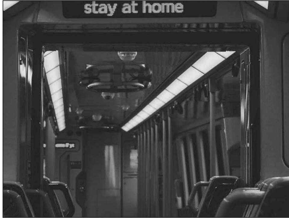
სიამოვნებაა და შეზღუდული ფინანსური მდგომარეობის პირობებში ადამიანებს ბევრ რამეზე უნვეთ უარის თქმა.

დედოფლისწყაროელი მოსახლეობაც და მკლულებიც მოუთმინლად ელიან საქალაქთაშორისო მგზავრობის აღდგენას და გზად არიან, დანახაული შეზღუდვები ზედმეტად არ იყოს.