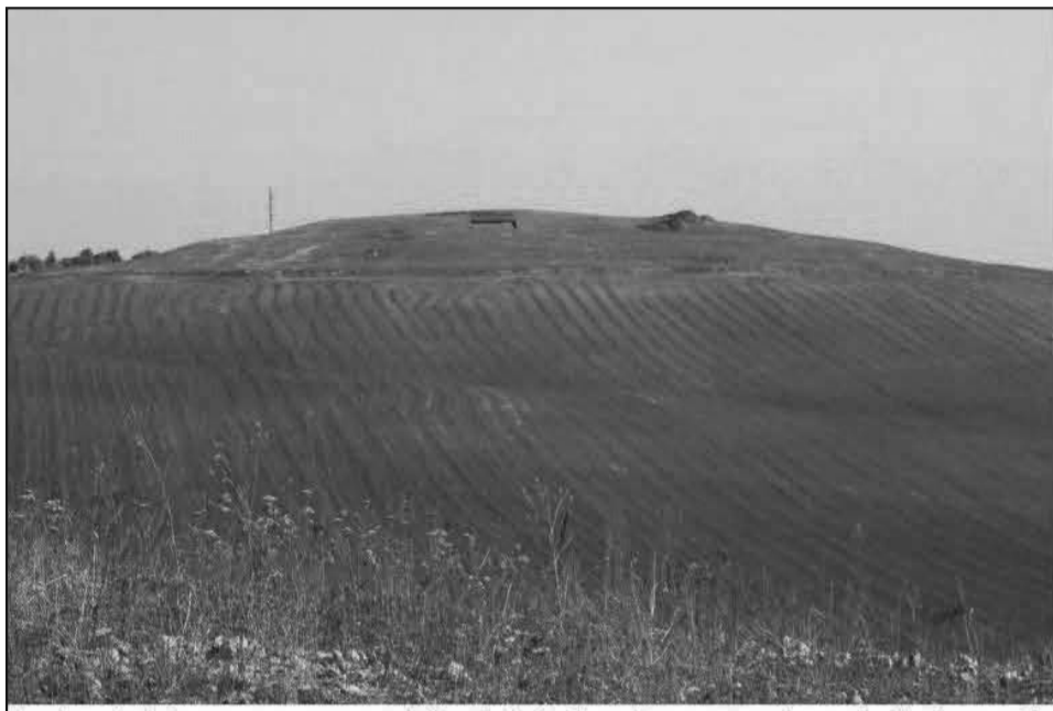
სურ. I: სამრეკლო, დედოფლისწყაროს მუნიციპალიტეტი, ხედი სამხრეთიდან. ბორცვის ცენტრში 2019 წლის თხრილები.

ჩვენ ამ ძეგლის შესახებ დანერვილებითი ინფორმაცია კულტურული მემკვიდრეობის სააგენტოს მივანოდეთ. როგორც ჩანს, სააგენტომ ჩათვალა, რომ ნამოსახლარი ძეგლის სტატუსის მინიჭება იმსახურებდა. ამ საკითხს სააგენტოში შესაბამისი სპეციალისტები წყვეტენ და როგორც ჩანს იმსჯელებს და მივიდნენ დასკვნამდე, რომ მნიშვნელოვანი იყო მისი აღიარება. თავდაპირველად აეროფოტოგადაღებებით გამოჩნდა რომ მინის ქვეშ მნიშვნელოვანი ინფორმაცია ინახებოდა. ზედა ფენები ქრისტემდე X-XIV საუკუნით თარიღდება და აუცილებლად იმსახურებს, ამ სტატუსს. წლების მანძილზე მრავალი მეცნიერი მუშაობდა აქ და ეს