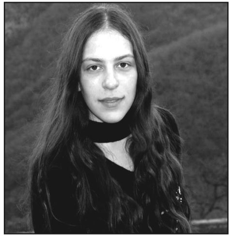
- გაიხსენეთ თქვენი ცხოვრების ერთ-ერთი ყველაზე დაუვიწყარი ამბავი...

- მთავარი დევიზი ალბათ ბედნიერების წვრილმანებში ძიებაა. უმჯობესია, ბედნიერება ყოველდღიურობაში, წვრილმანებში დავიხაზოთ და არა მხოლოდ რაიმე გრანდიოზულში.