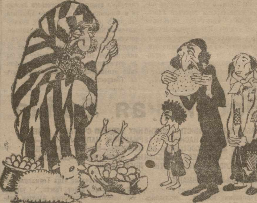
НАСТОЯЩАЯ ЕВРЕЙСКАЯ МАЦА ДОЛЖНА ГОТОВИТЬСЯ БЕЗ ЕДИНОГО ЯЙЦА.

Сегодня утром у нас Алонис воскрес И на небеса к патламе шес. — Пожаловал к нам ты, — жрецы молвила, — даром. Торчел мы точно таким-же товарищом.