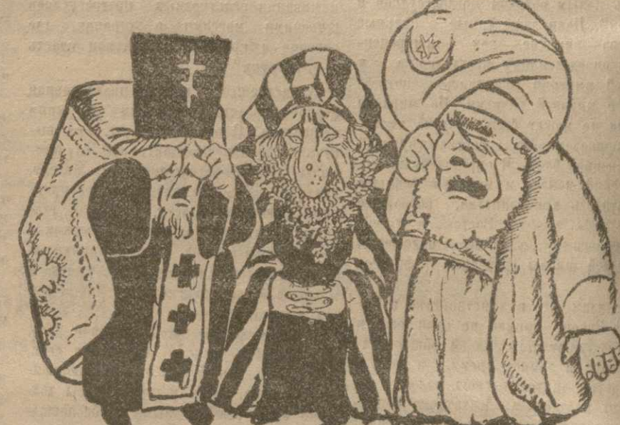
КОМСОМЛЬСКАЯ ПАСХА ИМ ЗДОРОВО НАСОЛИЛА!

Пашут поп, равнин с музлюю, Льются слезы, как вода: — Ну, и время-ж нынче озае. Комсомольская весна! Жили мы, беды не зная, Заклоченыа начались: Помогите, Алонис! Магомет и Оспирис! Пред ужасной стали драмой. Где были широты? Помогите, Кришна с Браной