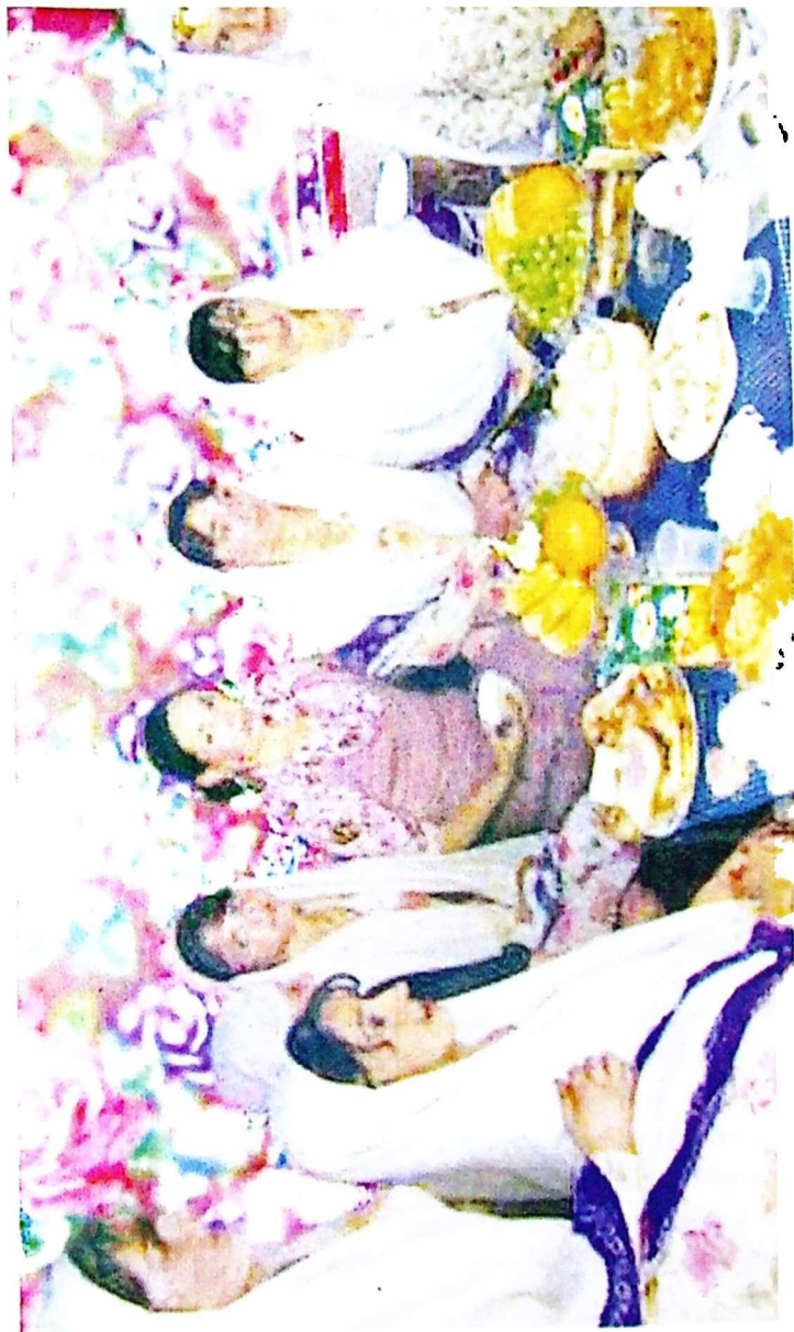
ანთროპოლოგი რას იტყვის?