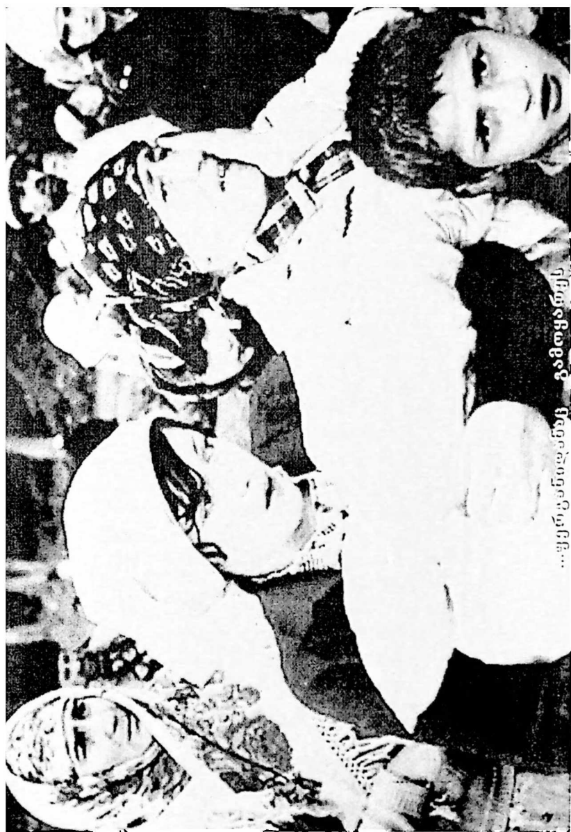
...მეტი უნდა იყოს გავრცელებული