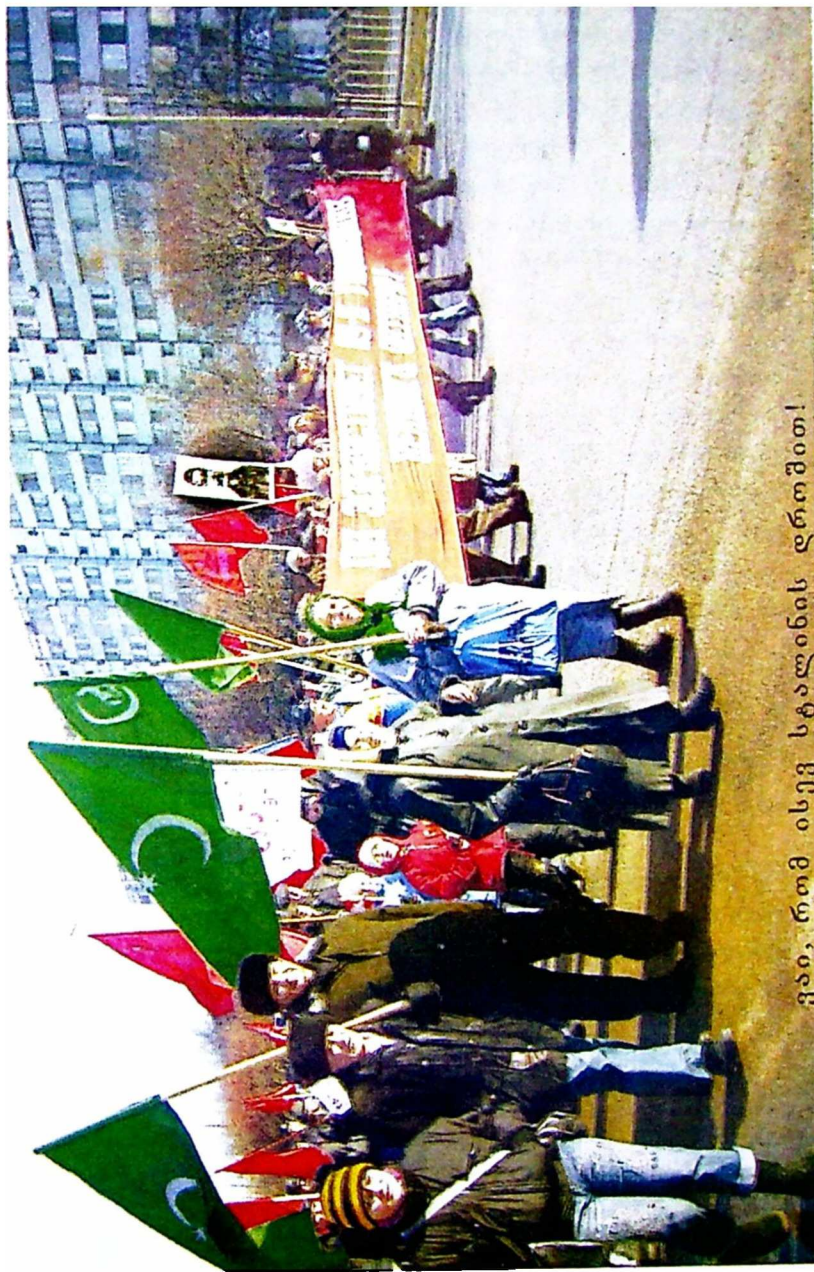
გაი, რთმ ისევ სტალინის დრომით!