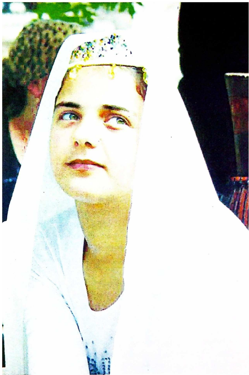
გულსარას ოცნებას ვერავინ დაუმლის