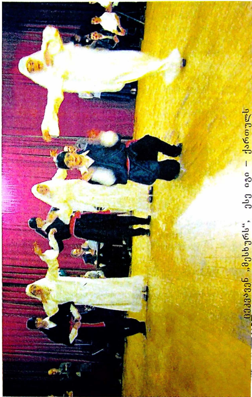
ტეკევავენი „მესხურს“, ესე იგი – ქართულს