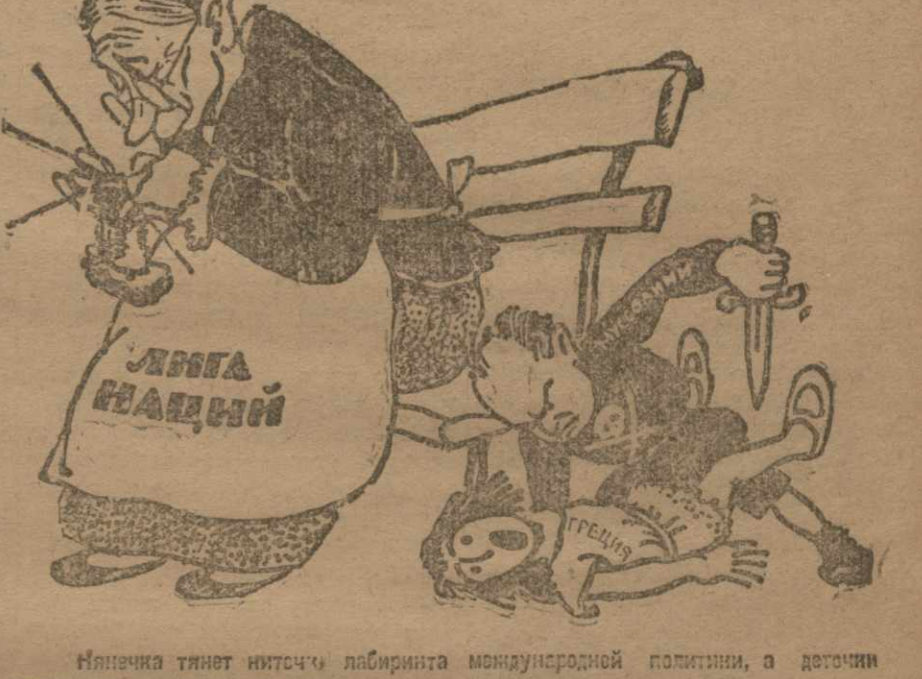
Няньчка тинет ниточки лабиринта международной политики, а детки пререпают вопросы по своему...