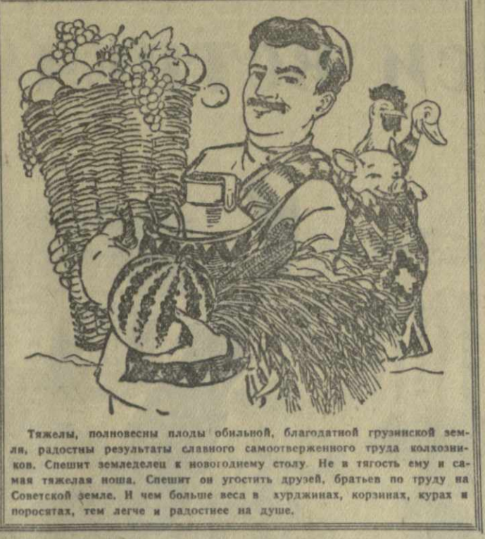
Тяжелы, полновесны плоды обильной, благодатной грузинской земли, радостны результаты славного самоотверженного труда колхозников. Спешит земледелец к новонаемому столу. Не в тягость ему и самая тяжелая ноша. Спешит он угостить друзей, братьев по труду на Советской земле. И чем больше веса в хурджинах, корзинах, кураж и поросках, тем легче и радостнее на душе.