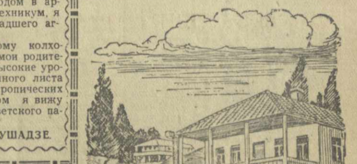
Много новых домов выросло в колхозном селе Арчеули. Рис. худ. Г. Ломидзе.

бы запознать себя в дом побольше, а уже встретит и этого мы сделаем с настоящим грузинским гордостью. — Господи, выжили из нас, а не с меня! — невнятно пробормотал он нечаянно, и из наветки смонжула уста.