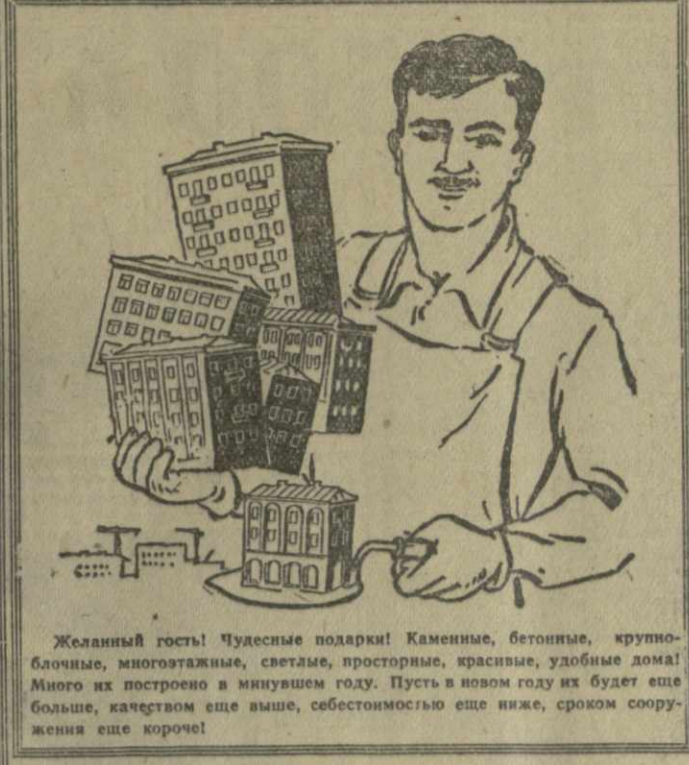
Желанный гость! Чудесные подарки! Каменные, бетонные, крупноблочные, многоярусные, светлые, просторные, красивые, удобные дома! Много их построено в минувшем году. Пусть в новом году их будет еще больше, качеством еще выше, себестоимостью еще ниже, сроком сооружения еще короче!