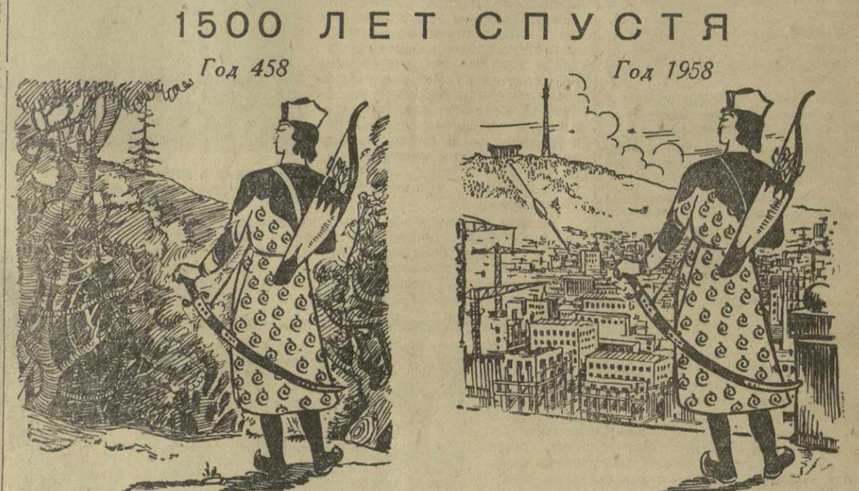
В глубоком раздумье стоит Горгасал, легендарный основатель Тбилиси. Перед ним высокая гора, за ним — красивая река, а кругом — леса, леса, дремучие леса... — Много придется потрудиться людям, — раздумывая в ту пору Горгасал, — чтобы на месте дремучих лесов выстроить город.

Мы приняли приглашение гостеприимного новосела. Дом, в котором он получил квартиру, находился рядом, и когда часы пробили ровно двенадцать, мы сидели за столом и поднимали тост за Старый и Новый год, за людей, чьими руками, чьим трудом было создано все то новое, о чем я рассказал в своем новогоднем интервью.