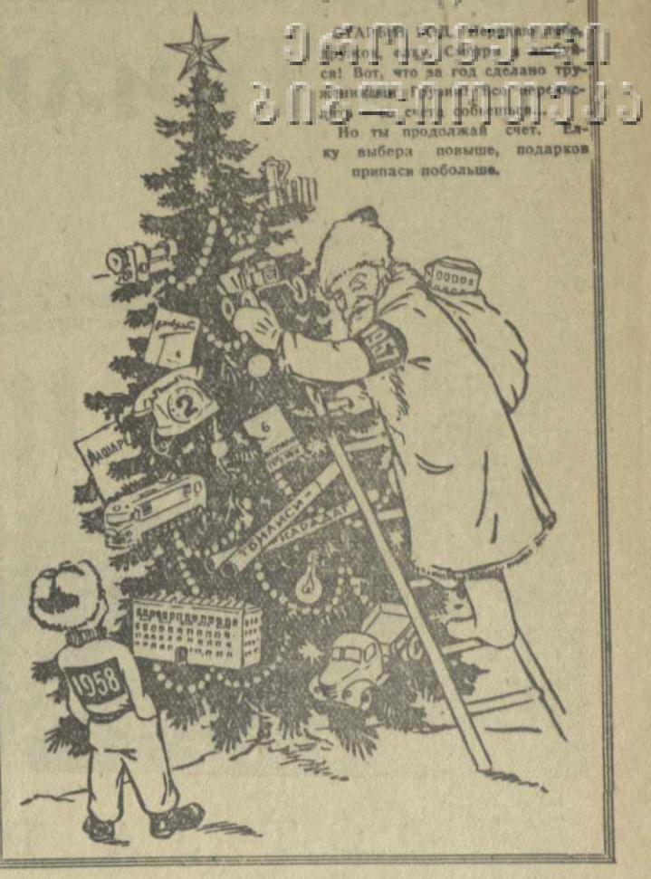
Вот, что за год сделано тружениками Грузии! Но ты продолжай свет, как улыбка повеяла, подарок припаси побольше.