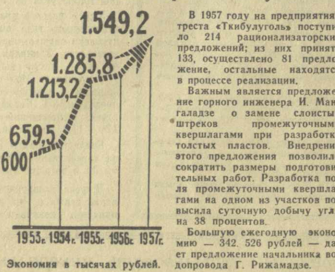
Экономия в тысячах рублей.