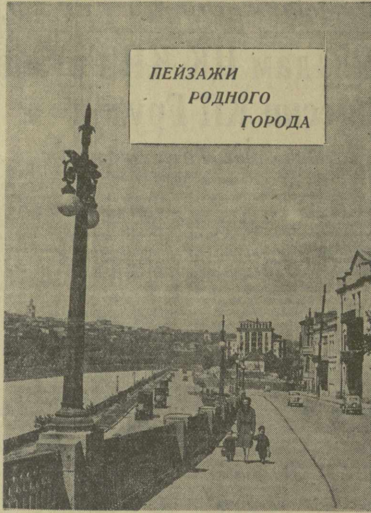
Необычно теплой, солнечной, бесснежной выдалась в этом году зима в Тбилиси. Конец января, а тбилисцы не видели еще ни снежного покрова, ни зимней стужи.

Воссоединению должны найти сами немцы. Газета выделяет то место в речи Н. С. Хрущева, где говорится о необходимости придания исторического факта существования в Германии двух государств с различным социальным строем.