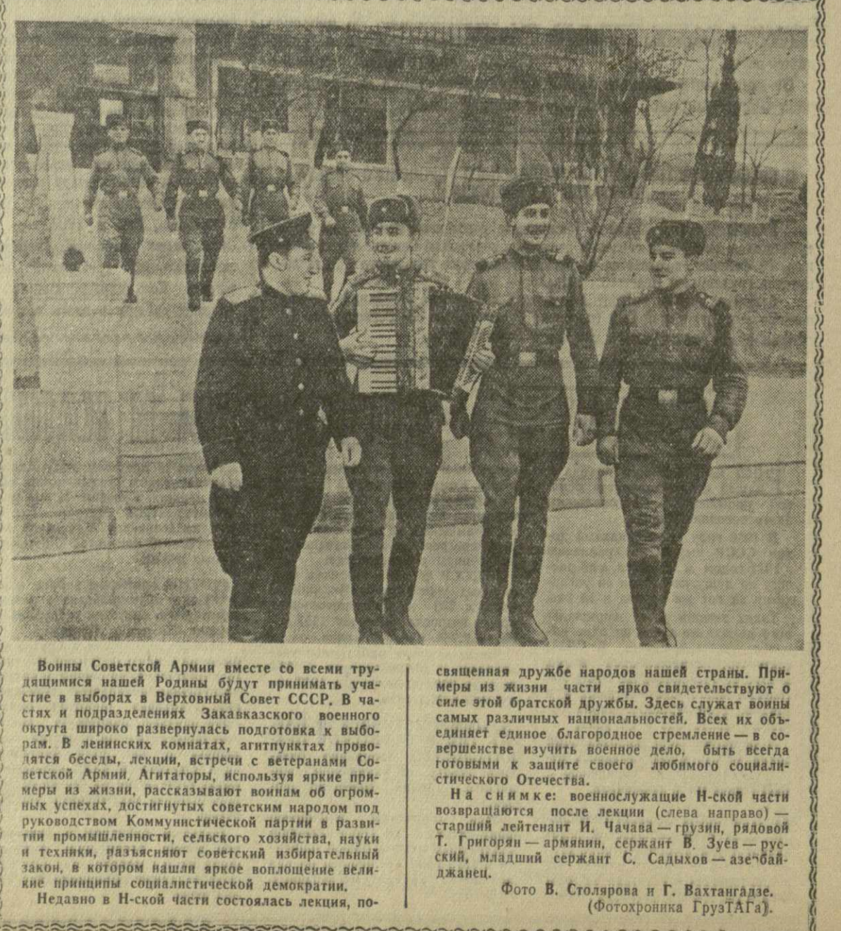
Вонны Советской Армии вместе со всеми трудящимися нашей Родины будут принимать участие в выборах в Верховный Совет СССР. В частях и подразделениях Закавказского военного округа широко развернулась подготовка к выборам. В лекционных комнатах, агитпунктах проводятся беседы, лекции, встречи с ветеранами Советской Армии. Агитаторы, используя яркие примеры из жизни, рассказывают о великом труде и успехах, достигнутых советским народом под руководством Коммунистической партии в развитии промышленности, сельского хозяйства, науки и техники, разъясняют советский избирательный закон, в котором наш народ воплощение великие принципы социалистической демократии. Недавно в Н-ской части состоялась лекция, посвященная выборам в Верховный Совет СССР.

Все в Декаде будет выпущено более ста книг, большая часть которых уже вышла в свет. Остальные книги находятся в различных стадиях полиграфического производства в типографиях Тбилиси, Еревана, Москвы и Ленинграда. Совершенно очевидно, что выполнение такого почетного и ответственного задания потребовало огромного напряжения сил всего коллектива издательства, работников полиграфических предприятий республики — всех тех, кто прямо или косвенно участвует в создании книги. До Декады осталось очень мало времени. Завершается большая и напряженная работа к предстоящему познанию лучших образцов грузинской литературы на творческом отчете в Москве. Как мы справились с этой задачей, об этом скажет свое слово всыскательный советский читатель. М. ЗЛАТКИН, директор издательства Союза писателей Грузии «Заря Востока».