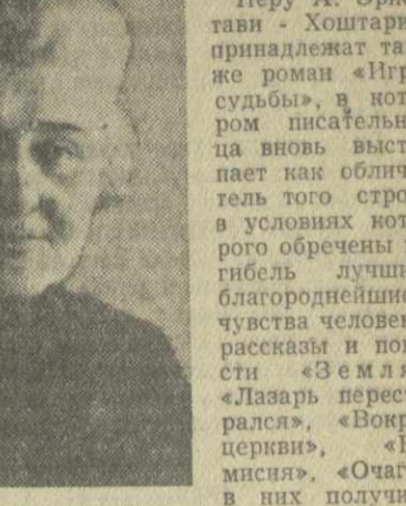
отражение и одна из главнейших тем ее творчества — борьба за расширение женщины.