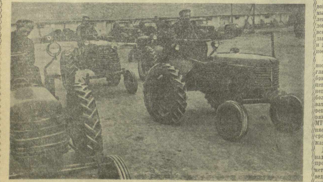
На снимке: тракторы колхоза перед выходом в поле.

И это было достигнуто всего лишь с помощью 5 тракторов. Большие перспективы открываются перед артелью, когда она приобретет богатую технику, ныне находящуюся в распоряжении МТС!