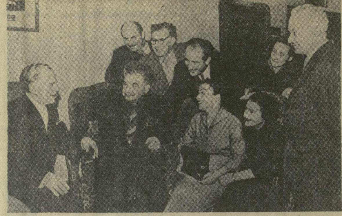
Грузинский государственный театр имени К. Марджанишвили показал на сцене Государственного академического Малого театра...