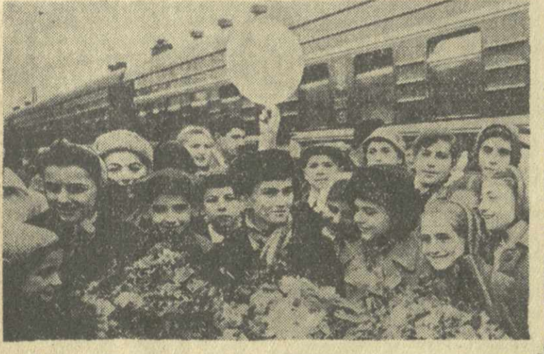
Вчера из Москвы возвратились в Тбилиси участники художественной самодеятельности Тбилисского Дворца пионеров и школьников, которые с успехом выступали в столице в дни Декады грузинского искусства и литературы.