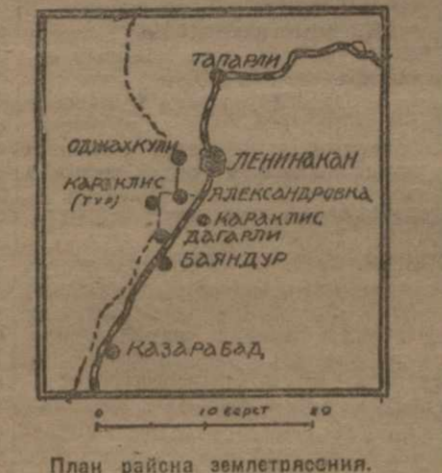
План района землетрясения.

(По прямому проводу, 23-Х, 5 ч. дня). ПО ПРЕДВАРИТЕЛЬНОМУ ПОДСЧЕТУ. ЭРИВАНЬ. 23-Х. Когда в Ленинангане произошло второй сильный толчок, все электричество в городе погасло. Сохранилась только одна лампочка. Все жители вышли на улицы. Сейчас же было объявлено экстренное заседание комиссии по ликвидации последствий землетрясения. Цели комиссии — ликвидация разрушений, улучшение жилищных условий пострадавших, восстановление связи с окрестными селами. БЕЗ ПРОВОДА. ЭРИВАНЬ. 23-Х. В Ленинангане отключено электричество. В городе отключено электричество. В городе отключено электричество. ЧРЕЗВЫЧАЙНАЯ КОМИССИЯ. ЭРИВАНЬ. 23-Х. Чрезвычайная комиссия совместно с пред. ЦИК тов. Ханюковым приступила к работам. Разрушено около 15 селений. Число пострадавших жителей в селениях и городах — около 800. Приняты меры к тотемному извлечению трупов погибших. ЖИЗНЬ ЗАМЕЛЛА. ЭРИВАНЬ. 23-Х. Разрушена масса частных домов и магазинов. В городе жизни замелла. Жизнь замелла. САМОТЕРЖЕННАЯ РАБОТА КРАСНОАРМЕТЦЕВ. ЭРИВАНЬ. 23-Х. На место землетрясения выехали отряды Красной Армии. Самоотерженная работа красноармейцев.