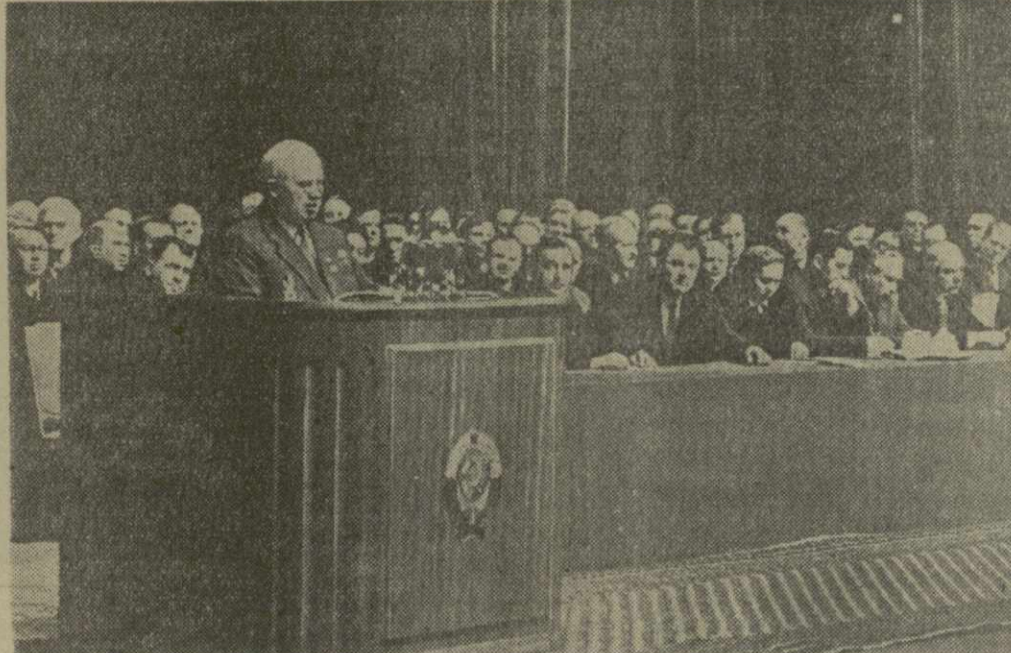
Москва, 10 апреля. Митинг трудящихся Москвы, посвященный возвращению на Родину Партийно-Правительственной делегации Советского Союза из поездки в Венгерскую Народную Республику. На снимке: на митинге во Дворце спорта Центрального стадиона имени В. И. Ленина. Выступает Н. С. Хрущев.

В нынешнем году подготовка к празднованию 1 Мая проходит в обстановке развернувшейся борьбы за осуществление решений первой сессии Верховного Совета СССР пятого созыва. Трудящиеся нашей республики, как и все советские люди, единодушно одобрили принятый сессией Закон «О дальнейшем развитии колхозного строя и реорганизации машинно-тракторных станций», осуществление которого позволит сделать новый крупный шаг на пути к коммунизму. Еще во время обсуждения тезисов доклада тов. Н. С. Хрущева «О дальнейшем развитии колхозного строя и реорганизации машинно-тракторных станций» ценную инициативу проявил коллектив Тбилисского станкостроительного завода имени Кирова. Он выступил инициатором оказания шефской помощи предприятиям колхозам. Десятки заводов и фабрик Грузии откликнулись на этот призыв и поддержали его. И сейчас, в дни предмайского соци-